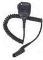
PMMN4067 IMPRES™ リモートスピーカーマイク